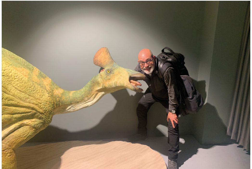
Gaudint de l'acurada reconstrucció del dinosaure Pararhabdodon isonensis al Museu de la Conca Dellà

Dellà i l'Institut Català de Paleontologia Miquel Crusafont: el jaciment de Basturs Poble.